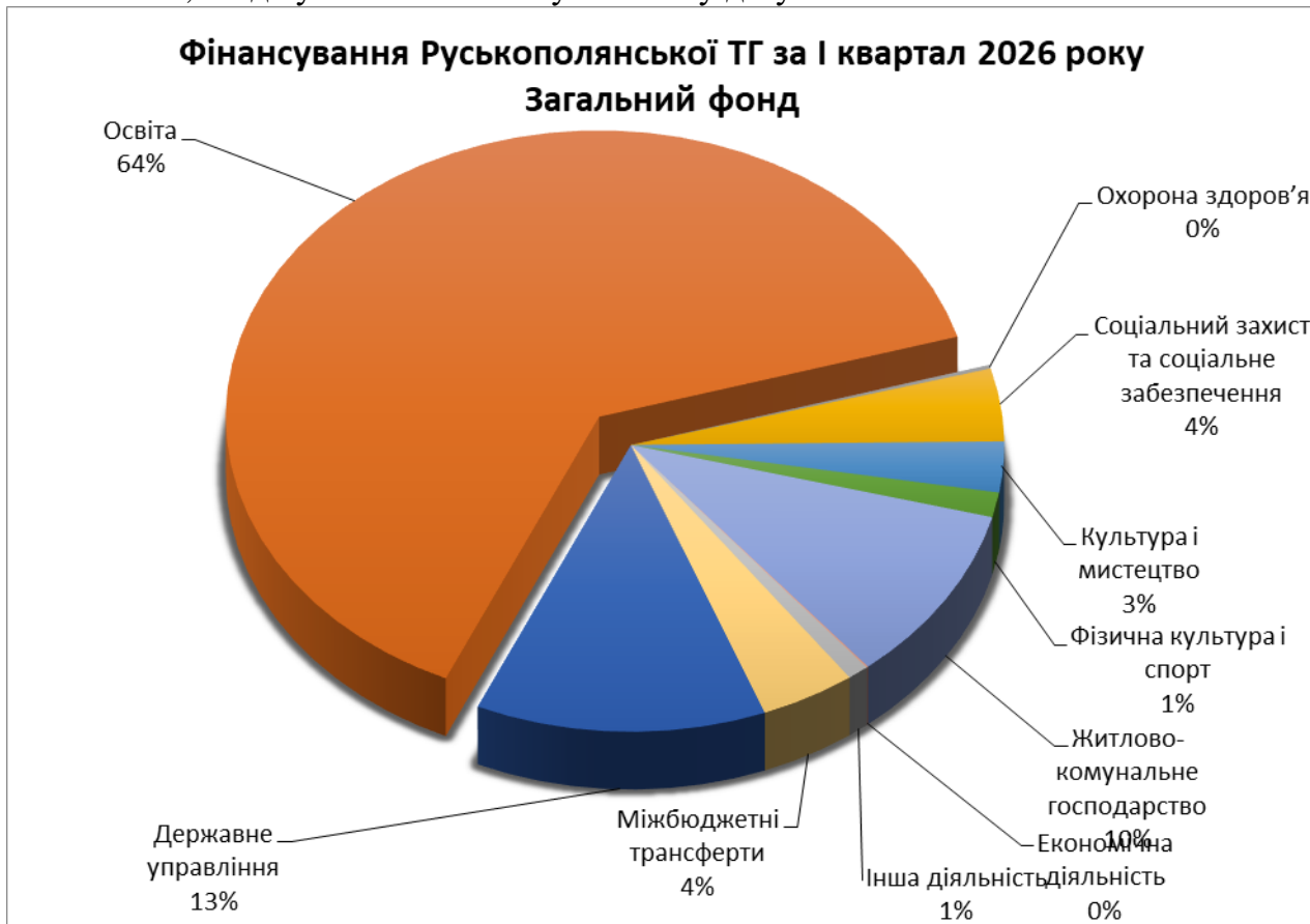
Діаграма 2. Структура видатків загального фонду бюджету Руськополянської територіальної громади станом на 01 квітня 2026 року (%).

суму в розмірі 45 234 140 грн. 69 коп. при затвердженому плані 65 734 324 грн. 54 коп. або 68,8% до уточненого плану на звітну дату.