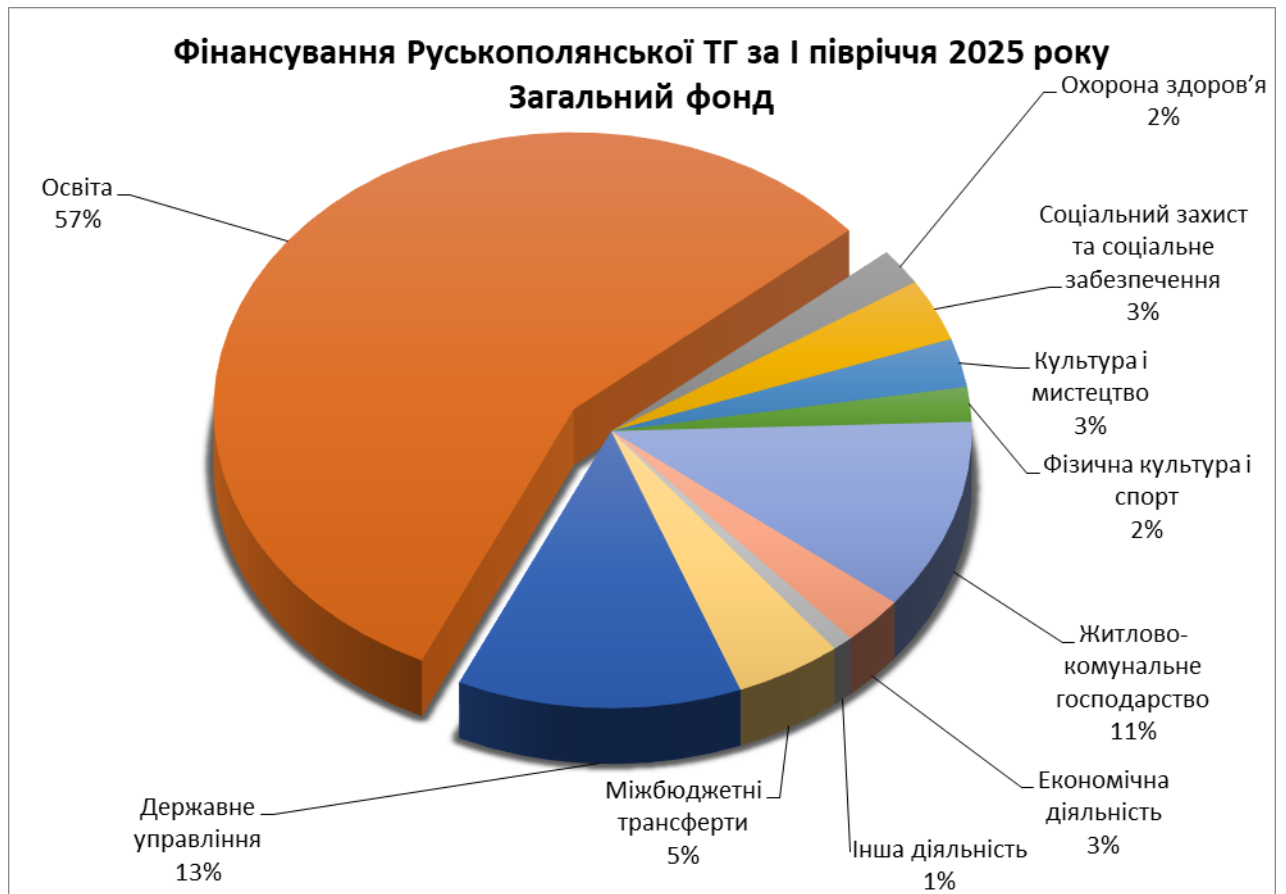
Діаграма 2. Структура видатків загального фонду бюджету Руськополянської територіальної громади станом на 01 липня 2025 року (%).