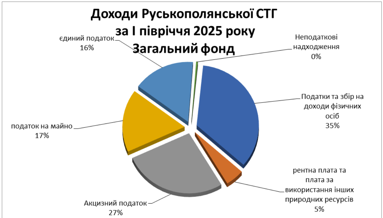
Діаграма 1. Структура доходів бюджету ТГ загального фонду (без трансфертних платежів) станом на 01 липня 2025 р. (%)