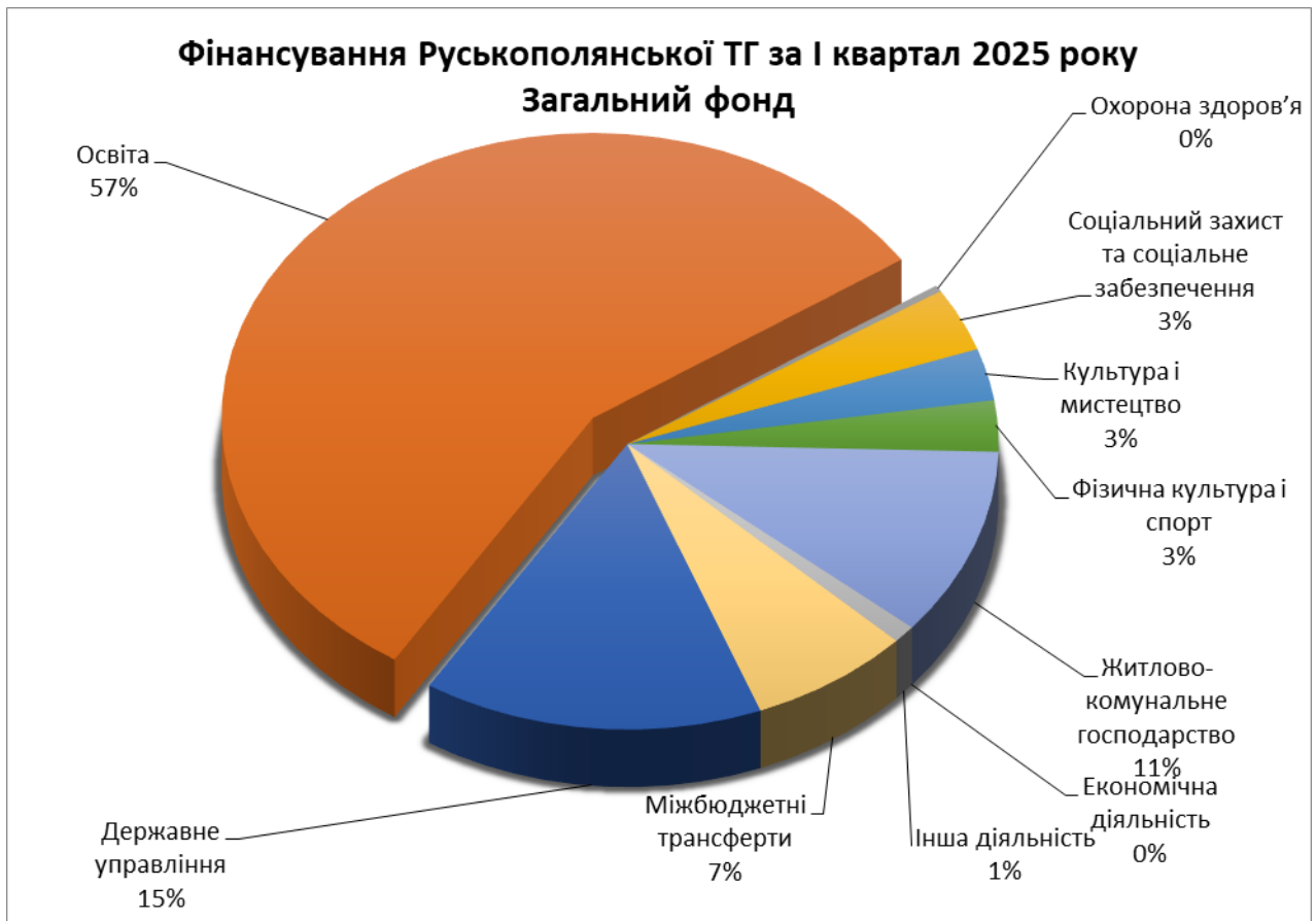
Діаграма 2. Структура видатків загального фонду бюджету Руськополянської територіальної громади станом на 01 квітня 2025 року (%).