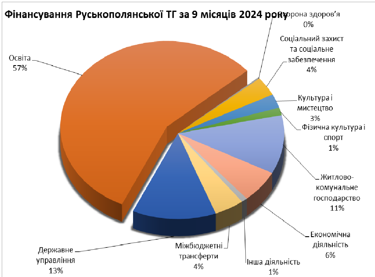
Діаграма 2. Структура видатків загального фонду бюджету Руськополянської територіальної громади станом на 01 жовтня 2024 року (%).